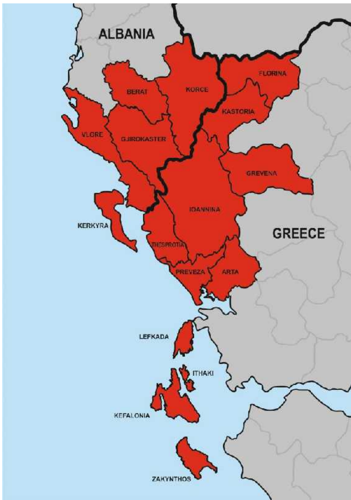
Χάρτης Επιλέξιμων Περιοχών Προγράμματος